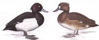
Vallisneriaente Aythya valisineria