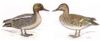
Krickente Nettion c. crecca