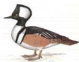
Kappensäger Lophodytes cucullatus