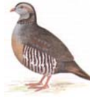
Klippenhuhn Alectoris barbara