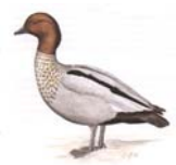
Mähngans Chenonetta jubata