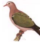
Grünflügeltaube Chalcophaps i. indica