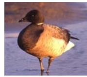
Ringelgans Branta bernida