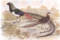
Amherstfasan (Diamant-) Chrysolophus amherstiae