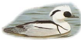
Zwergsäger Mergellus albellus