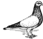
Coburger Lerche silber ohne Binden