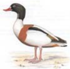
Brandgans Tadorna tadorna