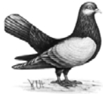
Orientalische Roller schwarz