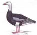
Schneegans Chen caerulescens