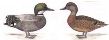
Sichelente Eunetta falcata