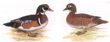
Brautente Aix sponsa