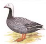
Kaisergans Philacte canagica