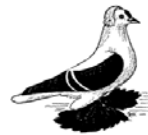
Sächsische Flügeltaube schwarz mit weißen Binden