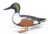
Löffelente Spatula clypeata

hv 96 SE 29 | 1,1 alt 39 Obermeyer Roland