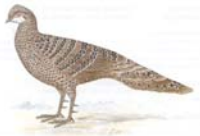
Grauer Pfau Polyplectron bicalcaratum