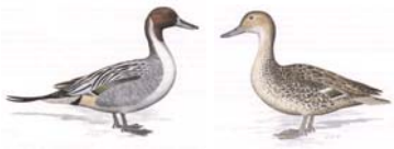
Spießente Dafila acuta

V 97 Teller | 1,1 alt hv 96 E | 36 Obermeyer Roland 37 Ott Elfriede