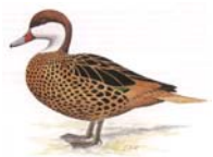
Bahamaente Paecilonetta b. bahamensis

V 97 Teller | 1,1 alt hv 96 E | 36 Obermeyer Roland 37 Ott Elfriede