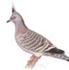
Australische Schopftaube Ocyphaps lophotes