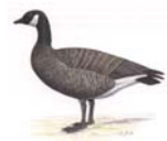
Zwergkanadagans Branta c. parvipes