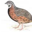
Harlekinwachtel Coturnix delegorguei