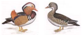
Mandarinente Dendronessa galericulata

sg 93 | 1,1 jung sg 94 SZ 16 | 41 Obermeyer Roland 45 42 Ritter Dietrich