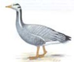
Streifengans Eulabeia indica