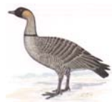
Hawaiigans Branta sandvicensis