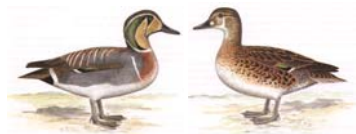
Baikalente (Gluck-) Nettion formosum