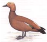
Rostgans Casarca ferruginea